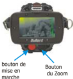
bouton de mise en marche Bouton du Zoom