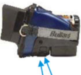
boutons latéraux pour déblocage de la batterie