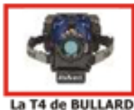
La T4 de BULLARD